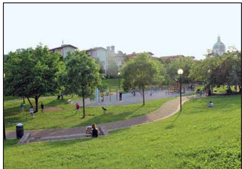
Il parco del centro storico di Montichiari.