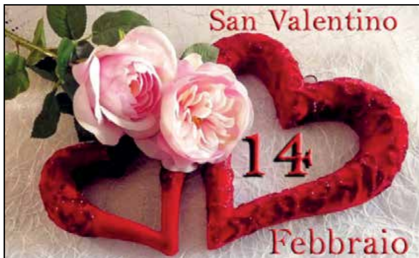
Sabato 13 febbraio, cena aspettando S. Valentino.

A partire dalle ore 20 il classico aperitivo della casa con stuzzichini caldi e freddi; un menù con antipasto di pesce e quello ricco all'italiana, risotto con fragole e mascarpone, cuoricini di san Valentino, filetto di branzino in crosta di patate con pomodorini pachino e verdure, sorbetto al limone, tagliata di vitello al rosmarino su letto di insalata, filetto di maialino con funghi champignons, patate novelle, verdure ai ferri, dol-