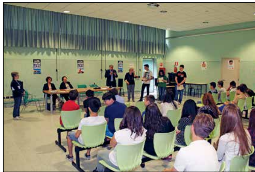
L'importanza del messaggio agli studenti delle medie.

Ogni tre anni viene rinnovato il Consiglio direttivo dell'AIDO di Montichiari. Per domenica 21 febbraio è stata convocata l'Assemblea Generale dei circa mille iscritti che dovranno eleggere i nuovi rappresentanti. La riunione si svolgerà presso il Centro diurno Casa